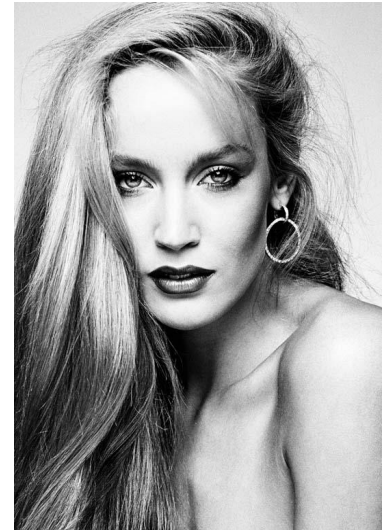
David Bowie, London, 1984 (links) / David Hockney, Malibu, 1989 (mittig) / Jerry Hall, Los Angeles, 1978 (rechts)

Am 13. März 2019 eröffnet die Einzelausstellung The Outsiders des amerikanischen Starfotografen Greg Gorman in der Münchner Galerie IMMAGIS. Mit Best of and beyond zeigt Gorman einen faszinierenden Querschnitt seiner Bildknoten, die international renommierte Musiker, bildende Künstler und Schauspieler abbilden. So sehen wir z.B. David Bowie , mit dem Gorman über 15 Jahre zusammen arbeitete, seine langjährige enge Freundin Grace Jones , aber auch Klassiker wie den Factory-Gründer Andy Warhol mit dunkler Sonnenbrille, Sharon Stone am Anfang ihrer Karriere, den ehemaligen Spitzensportler Michael Jordan , Ex-Jagger-Frau Jerry Hall , den berühmten Musiker Bryan Ferry , die britische Künstlerikone David Hockney und viele mehr.