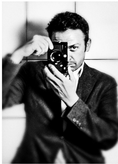
Selbstporträt Till Brönnner

Till Brönnner (*1971, Viersen) gilt als Kosmopolit. Er lebt und arbeitet seit Jahren zwischen Berlin und Los Angeles und ist überall zuhause. Seit zehn Jahren ist der Musiker auch erfolgreich als Fotograf tätig. Sein Bildband „Faces of Talent“ (teNeues) mit einfühlsamen S/W-Porträts von Musikerkollegen und anderen prominenten Persönlichkeiten brachte ihm 2015 erhebliches mediales Interesse ein. Mehr unter www.tillbroenner-photography.com .