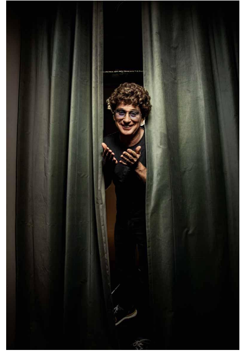
Mario Götze, Dortmund 2018 (links) | Museum der Zeche Zollverein, Essen 2019 (mittig) | Atze Schröder, 2019 (rechts), alle Fotos: © Till Brönner

Vom 3. Juli bis 6. Oktober 2019 wird das Museum Küppersmühle zum „ Melting Pott “ und präsentiert die bislang umfangreichste Ausstellung des renommierten Musik- und Foto-Künstlers Till Brönner . Über ein ganzes Jahr lang fotografierte Deutschlands Jazz-Musiker Nr. 1 Menschen und Orte in einer der vielfältigsten und ambivalentesten Regionen Deutschlands: Ein persönlicher Blick auf Gesichter, Industrie-Architektur, Natur- und Kulturlandschaften, Verkehr und Urbanes, buntes Mit- und Nebeneinander verschiedener Nationen und Religionen in Deutschlands größtem Ballungsraum.